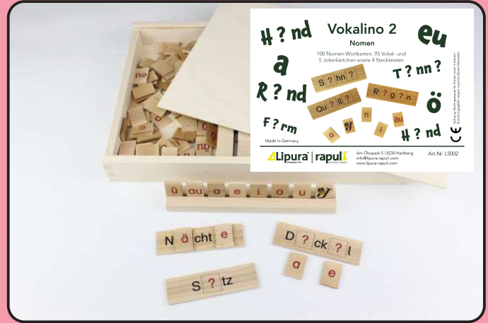
Vokalino 2 - Nomen Art.-Nr.: L5002

Holzkasten mit je 100 Wortplättchen (100 x 29 x 3mm), 100 Vokalplättchen (20 x 29 x 3mm) und 4 Steckleisten