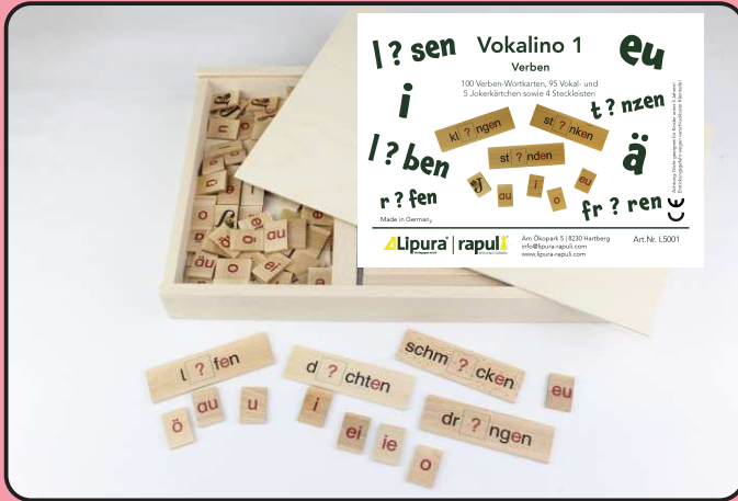
Vokalino 1 - Verben Art.-Nr.: L5001