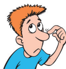
eine lange Nase