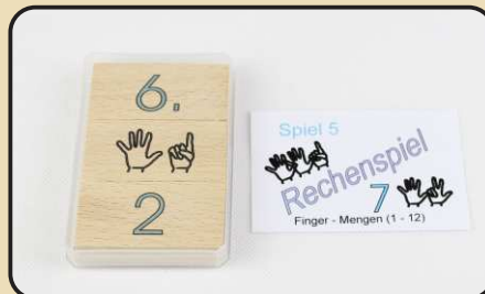
Spiel 7: Finger - Mengen (1 - 12)