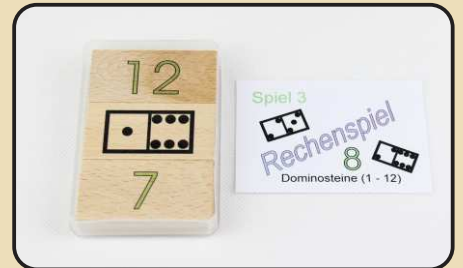
Spiel 3: Dominosteine (1 - 12)