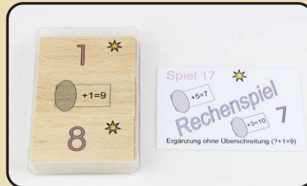
Spiel 17: Ergänzung ohne Überschreitung ( ? + 1 = 9 )