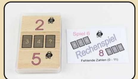
Spiel 6: Fehlende Zahlen (0 - 11)