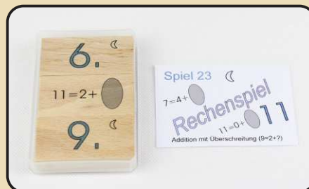
Spiel 23: Addition mit Überschreitung ( 9 = 2 + ? )