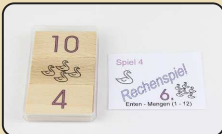
Spiel 4: Enten - Mengen (1 - 12)