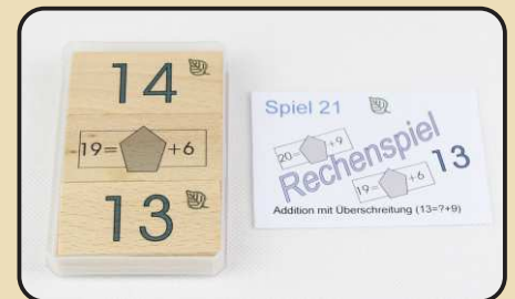
Spiel 21: Addition mit Überschreitung ( 13 = ? + 9 )