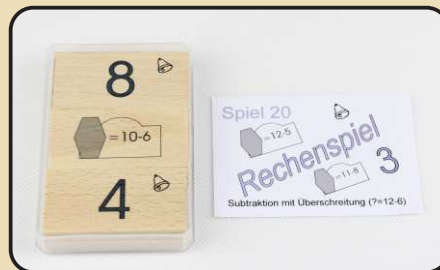
Spiel 20: Subtraktion mit Überschreitung ( ? = 12 - 6 )