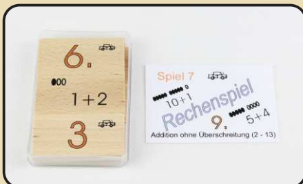
Spiel 7: Addition ohne Überschreitung (2 - 13)