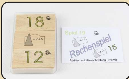
Spiel 19: Addition mit Überschreitung ( ? = 6 + 5 )