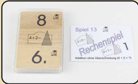
Spiel 13: Addition ohne Überschreitung ( 6 + 2 = ? )