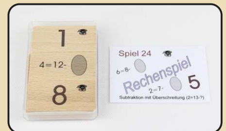
Spiel 24: Subtraktion mit Überschreitung ( 2 = 13 - ? )