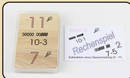
Spiel 8: Subtraktion ohne Überschreitung (0 - 11)