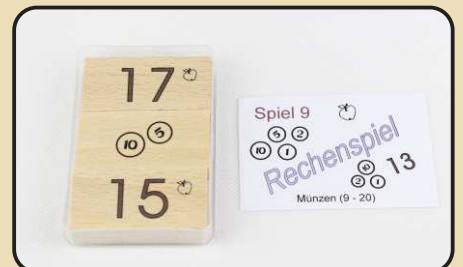
Spiel 9: Münzen (9 - 20)