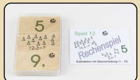
Spiel 12: Subtraktion mit Überschreitung (1 - 15)