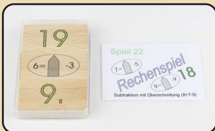
Spiel 22: Subtraktion mit Überschreitung ( 8 = ? - 9 )