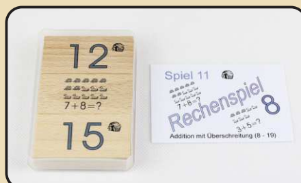
Spiel 11: Addition mit Überschreitung (8 - 19)