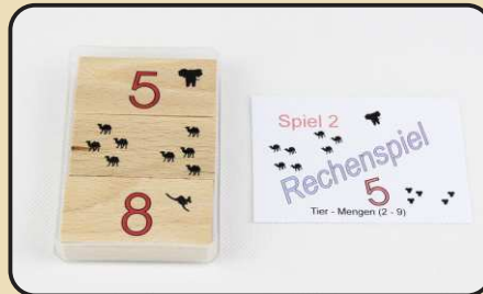
Spiel 2: Tier - Mengen (2 - 9)