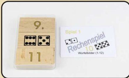
Spiel 1: Würfelbilder (1 - 12)

Holzkasten mit 24 verschiedenen Einzelspielen Art. Nr. L617013