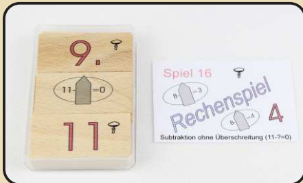
Spiel 16: Subtraktion ohne Überschreitung ( 11 - ? = 0 )