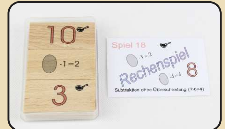
Spiel 18: Subtraktion ohne Überschreitung ( ? - 6 = 4 )