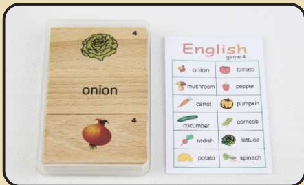
Spiel 4: Gemüse (onion, carrot, cucumber...)