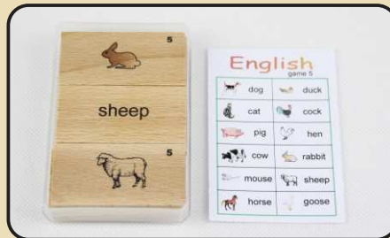
Spiel 5: Haustiere (dog, cock, rabbit...)