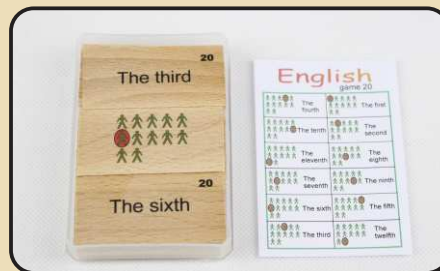
Spiel 20: Zahlwörter (The eighth, The first...)