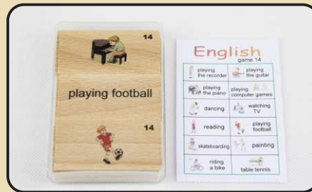
Spiel 14: Hobbys (reading, painting, dancing...)