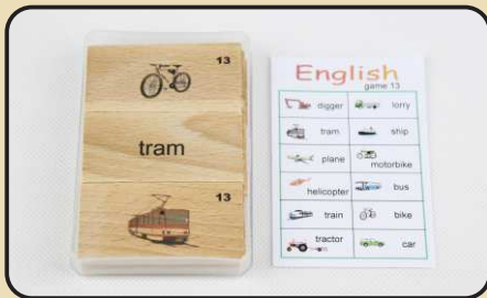
Spiel 13: Fahrzeuge (train, bike, tractor...)