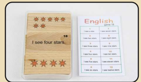
Spiel 18: Sätze mit Zahlwörtern (I see three stars. ...)