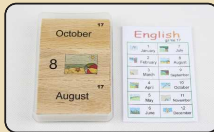
Spiel 17: Monate (January, February, March...)