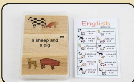
Spiel 22: leseleichte Wortgruppen mit Tieren (a hen and a fox...)