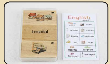
Spiel 21: In der Stadt (bus stop, hospital, post office...)