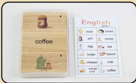
Spiel 1: Frühstück (cheese, bacon, butter...)