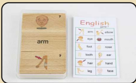
Spiel 7: Körperteile (eye, ear, face...)