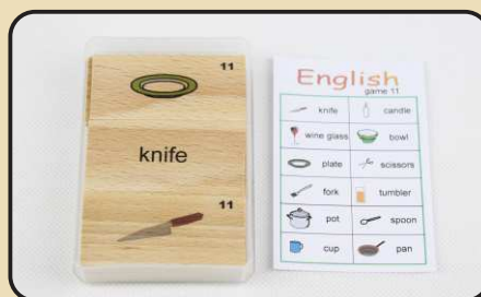
Spiel 11: Haushaltsgegenstände (knife, bowl, pot...)