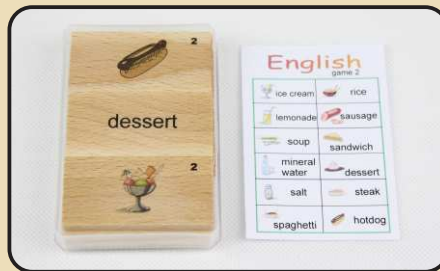
Spiel 2: Lebensmittel (spaghetti, sandwich, soup...)