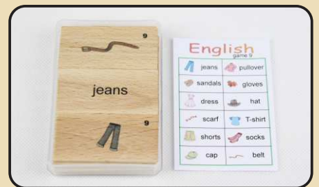
Spiel 9: Kleidungsstücke (dress, hat, socks...)