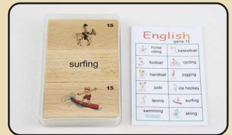
Spiel 15: Sport (tennis, surfing, horse riding...)