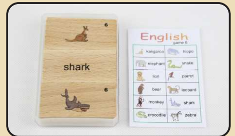
Spiel 6: Zootiere (elephant, parrot, monkey...)