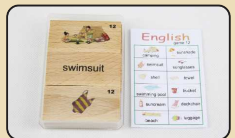
Spiel 12: Urlaub (camping, sunshade, deckchair...)