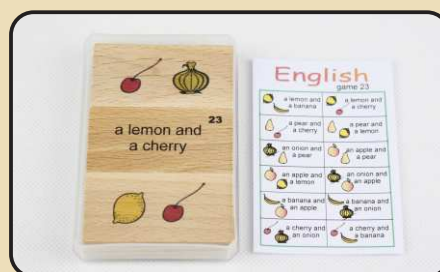
Spiel 23: leseleichte Wortgruppen mit Obst (an apple and a pear...)