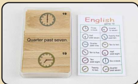
Spiel 19: Uhrzeit (Half past eight...)