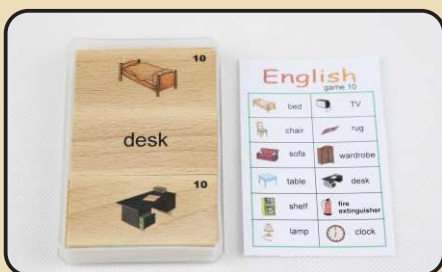
Spiel 10: Einrichtungsgegenstände (bed, chair, wardrobe...)