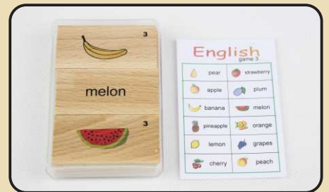
Spiel 3: Obst (orange, melon, plum...)