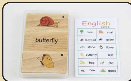
Spiel 8: Natur (stone, grass, frog...)