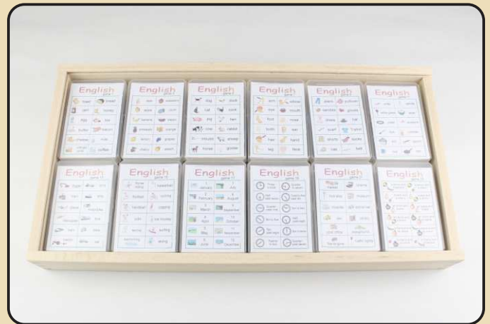
Holzkasten mit 24 verschiedenen Einzelspielen Art.Nr. L617037