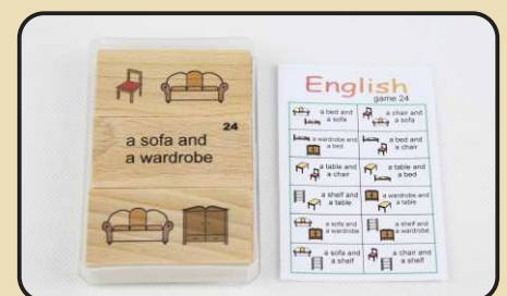
Spiel 24: leseleichte Wortgruppen mit Möbelstücken (a shelf and a table...)